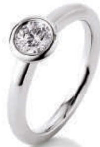
S20-A18 0.50 ct