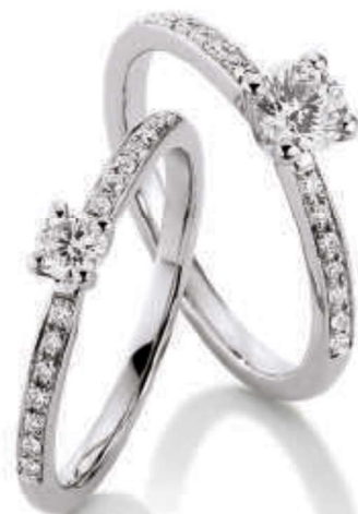
bagues de fiançailles | 11