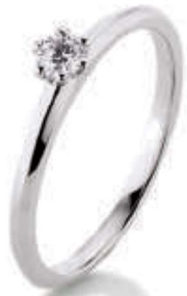
S10-A18 0.15 ct