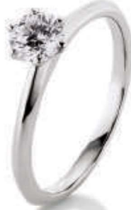
S14-A18 0.50 ct