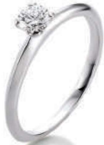
S4-A18 0.30 ct