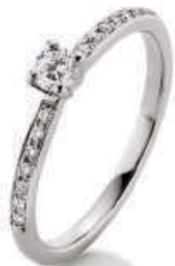
S7-A18 0.30 ct