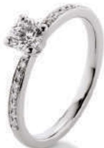
S8-A18 0.50 ct