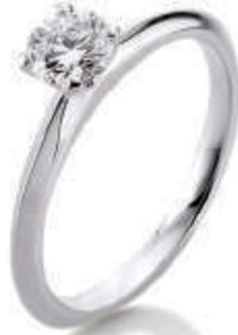
S6-A18 0.50 ct