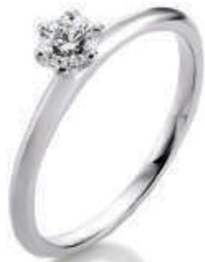
S12-A18 0.30 ct