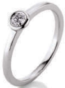
S16-A18 0.15 ct