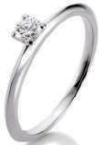
S2-A18 0.15 ct