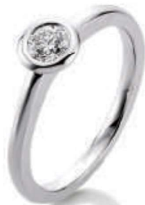
S18-A18 0.30 ct